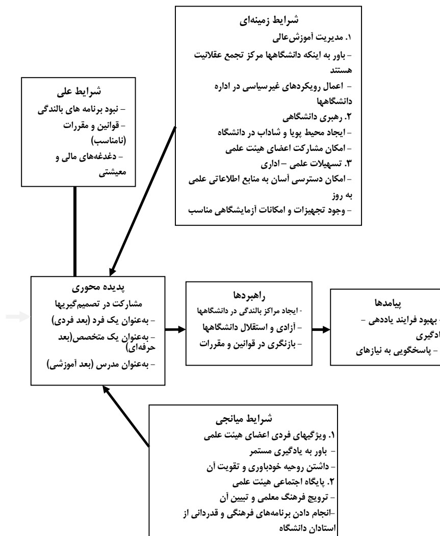
شکل ۲- کدگذاری محوری بالندگی اعضای هیئت علمی